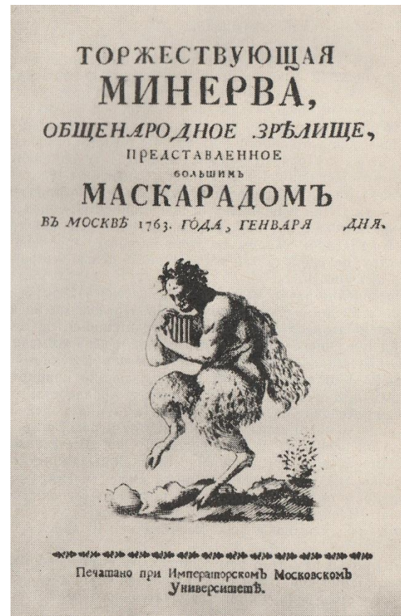
Титульный лист либретто маскарад Торжествующая Минерва, сочинения Ф. Г. Волкова (1763)

Прожил Волков 34 года. Свой последний спектакль он сыграл 29 января, выступив в своей лучшей роли Оскольда в трагедии Сумарокова «Семира». Но титул «первого русского актера» навсегда закрепился за ним.