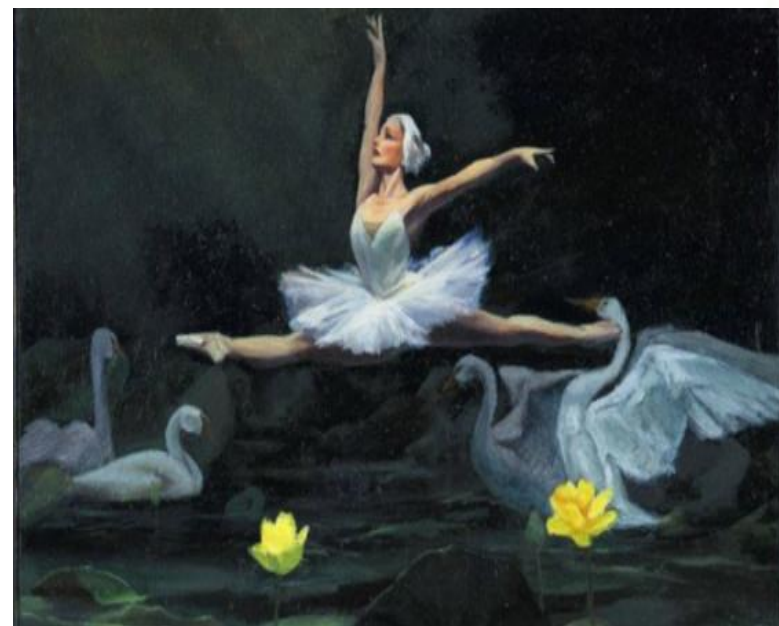
Чайковский балет «Лебединое озеро»

Этот первый пожалованный ему подарок он бережно хранил как драгоценнейшее воспоминание. Современники вспоминали, что с первых спектаклей Петипа поразили своей работоспособностью, танцевальной техникой, сценическим обаянием. Он крепко привязался к своей второй родине и через 20 лет, в 1869 году, становится главным хореографом императорской сцены. Творческий путь Петипа в России продолжался около 60 лет. Полвека своей жизни Мариус Иванович посвятил одному из ведущих мировых музыкальных театров – Мариинскому. За это время он поставил более 60 великолепных балетов со своим сводом правил балетного искусства, который и сегодня является основой классического балета. Созданные им спектакли и в настоящее время украшают репертуар самых знаменитых театров мира: «Пахита», «Дон Кихот», «Раймонда», «Баядерка», «Спящая красавица»... Непревзойденным шедевром Петипа считается спектакль «Лебединое озеро». В 1984 году Мариус Петипа получил российское гражданство и навсегда стал россиянином. Основная часть плодотворной творческой деятельности гениального хореографа, проходила в России.