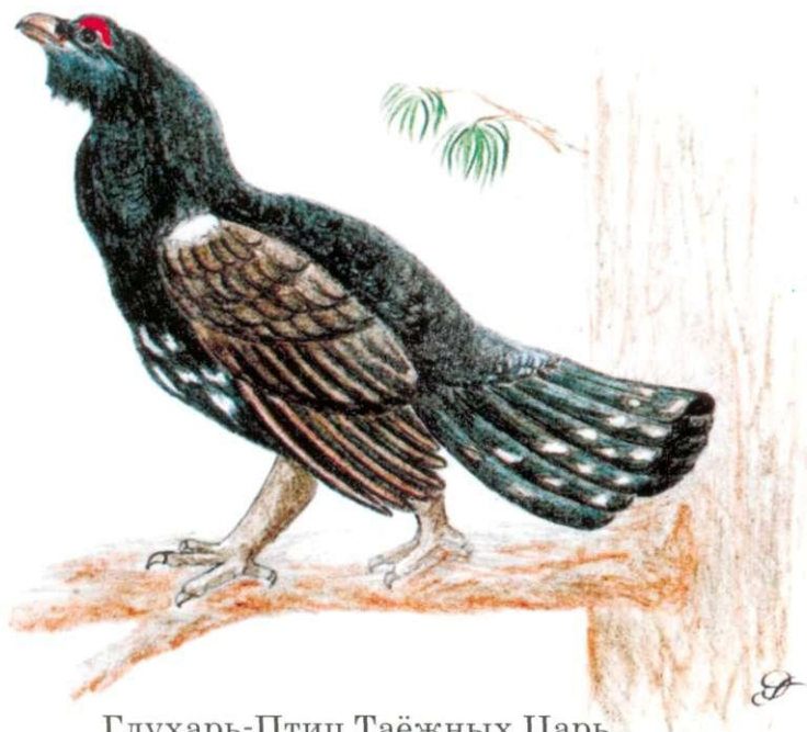
Глухарь-Птиц Таёжных Царь

Мимо как раз глухарь пролетал. Услышал гомон на кедре, опустился на ветку. Понял, о чём дятел рассказывает, и сам беседу поддержал: «Вот возьми меня, к примеру. Летом я ягодами питаюсь - брусникой, черникой, голубикой, морошкой, а к зиме на хвою перехожу. Предпочитаю, конечно, хвою лиственницы, особенно когда иголки осенью пожелтели и на землю упали: она самая мягкая да сладкая для меня. А уж когда снег выпадет, тогда сосна и кедр - мои главные деревья. Полкилограмма хвои в день - мой рацион! Смотрите, какой я крепкий и сильный! Ни один домашний петух со мной не сравнится! И всем я совет даю: жуйте и клюйте хвою!»