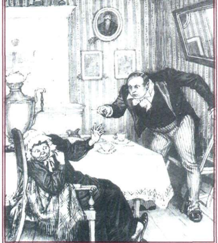
Иллюстрация к поэме Н. Гоголя «Мёртвые души» 1952 год