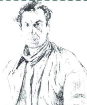
Автопортрет. 1943 год