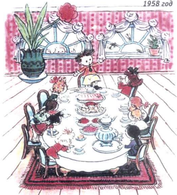
«Приключения Незнайки и его друзей» 1958 год