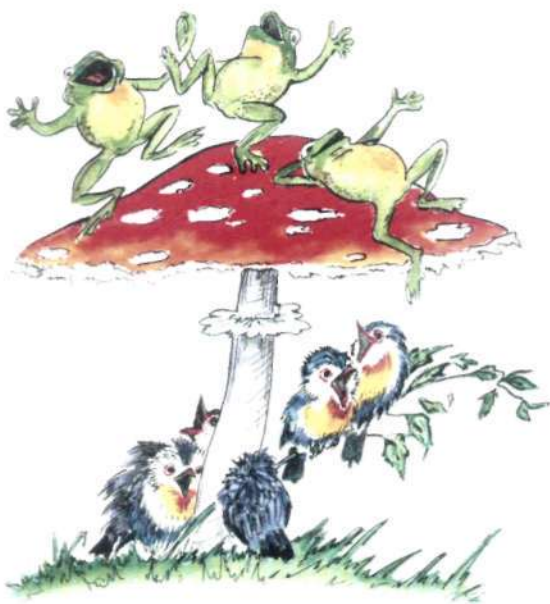
Иллюстрация к книге А. Лаптева «Футы-нуты» 1961 год

Л я г у ш к и: Дождик-дождик, пуще! Дам тебе гущи.