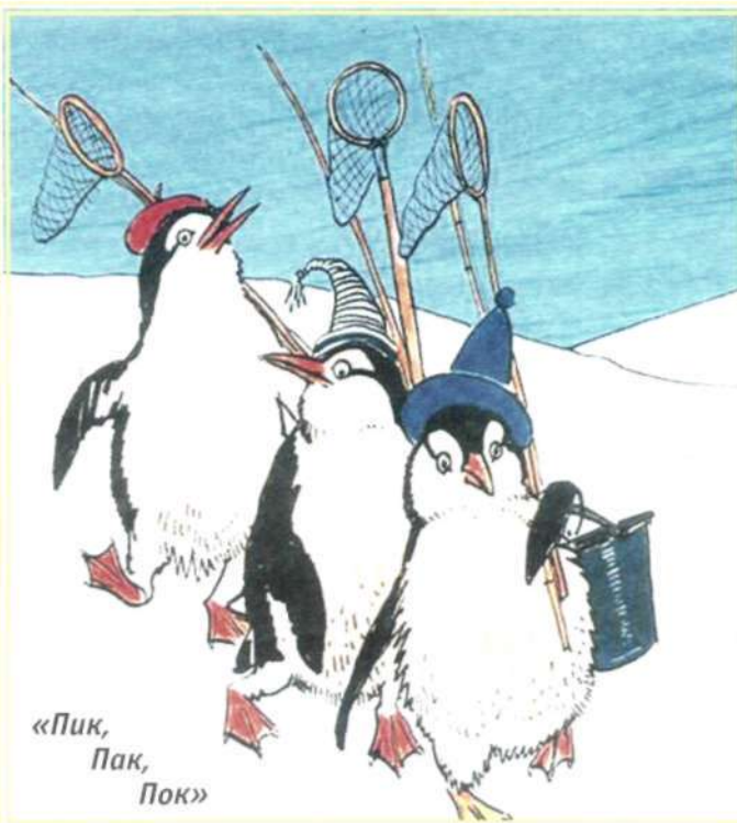
«Пик, Пак, Пок»