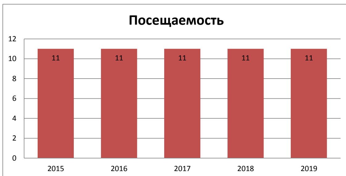
Рис. 4. Динамика количества посещаемости муниципальных библиотек читателями возраста до 14 лет.

Посещаемость - Средний показатель посещаемости детьми библиотек области в 2019 г. составил – 11, в 2018 г. – 11, т.е. остался без изменений. (Предельные значения: 8-17)