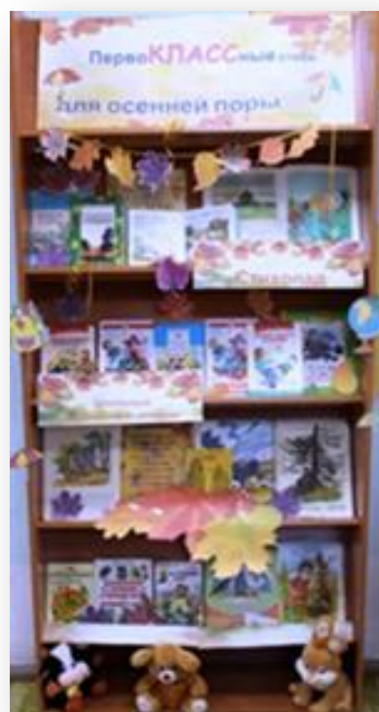
«Книжные соблазны осени»