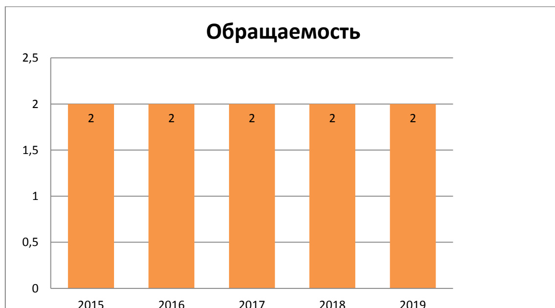
Рис. 6. Динамика показателя обращаемости библиотечного фонда для детей до 14 лет.

Обращаемость - величина, являющаяся оптимальным уровнем использования фонда. Показатель обращаемости фонда остаётся стабильным. В 2019 г. средний показатель обращаемости составил – 2, в 2018 г. также – 2. (Предельные значения: 0.5-2)