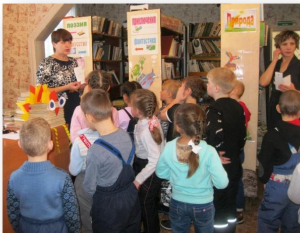
«Первые шаги в библиотеку» МБУ «Кривошеинская ЦБС»