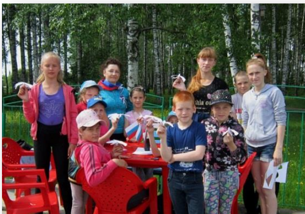
"Читальный зал под зонтиком": акция по привлечению к чтению МБУК «Бакcharская межпоселенческая централизованная библиотечная система