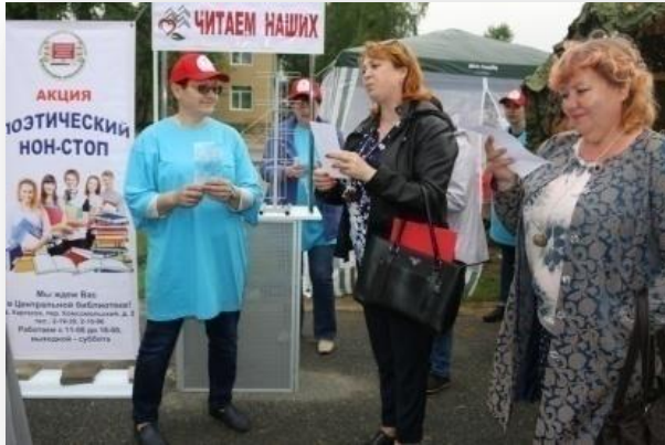
«Читаем наших»: поэтический нон-стоп МБУК «Каргасокская ЦРБ»