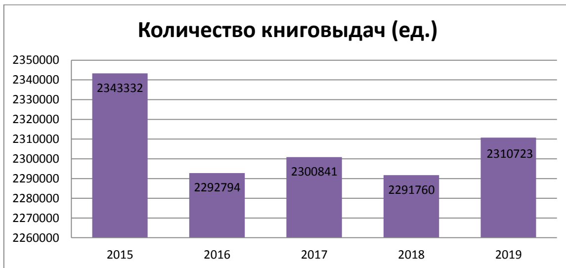
Рис. 3. Динамика количества книговыдачи читателям возраста до 14 лет.

Книговыдача детской литературы в библиотеках области в 2019 г. составила – 2310723, в 2018 г. составила – 2291760, больше на 18963