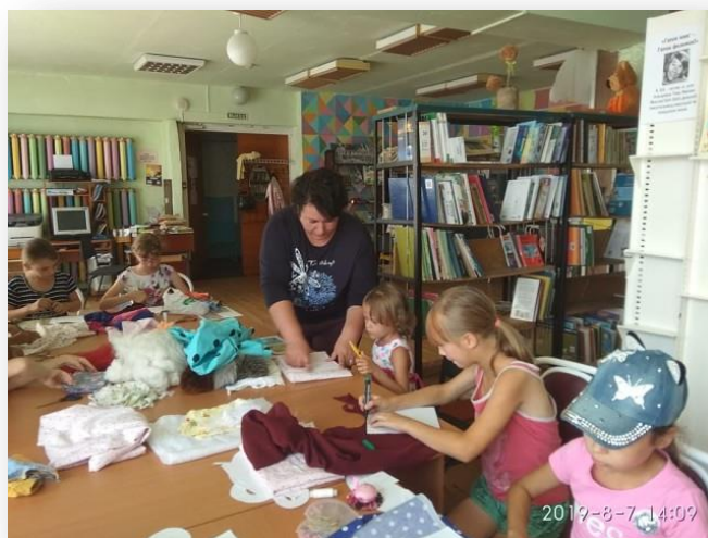
«Развивающая мягкая книга своими руками»: мастер – клас МКУ «Тегульдетская районная» ЦБС