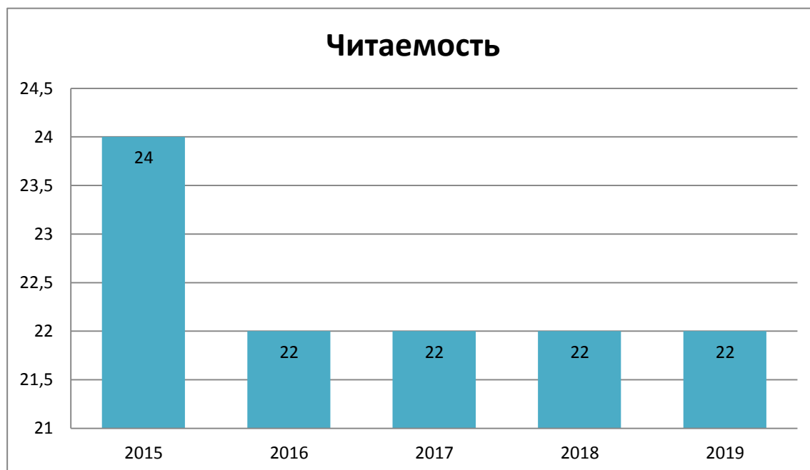
Рис. 5 Динамика показателя читаемости детей до 14 лет.

Читаемость - характеризует интенсивность чтения пользователей библиотеки. Средний областной показатель читаемости составил в 2019 г. – 22, 2018 г. – 22 экз. (Предельные значения: 15-25)