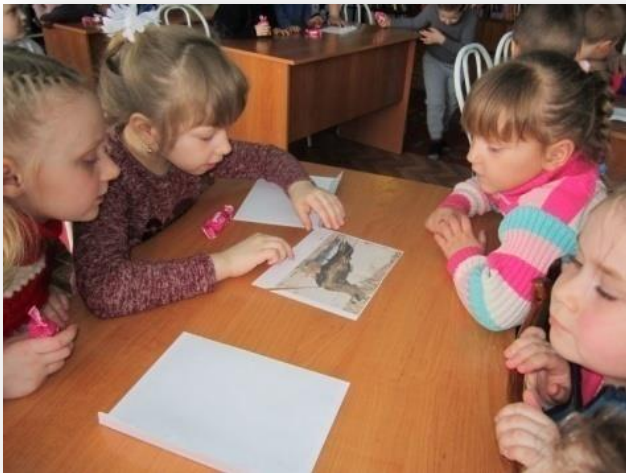
"Приведи в порядок планету": эколого-познавательная программа МКУК «Шегарская межпоселенческая Централизованная библиотечная система»