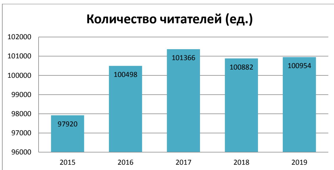
Рис. 1. Динамика количества читателей до 14 лет.

Количество читателей детей в библиотеках Томской области в 2019 г. составило – 100954, в 2018 г. составило – 100882, т.е. на - 72 чел. больше. Количество читателей увеличилось в МБУ «Асиновская межпоселенческая централизованная библиотечная система», МБУ «Библиотека» г. Колпашево, МКУ «Тегульдетская РЦБС» и др.