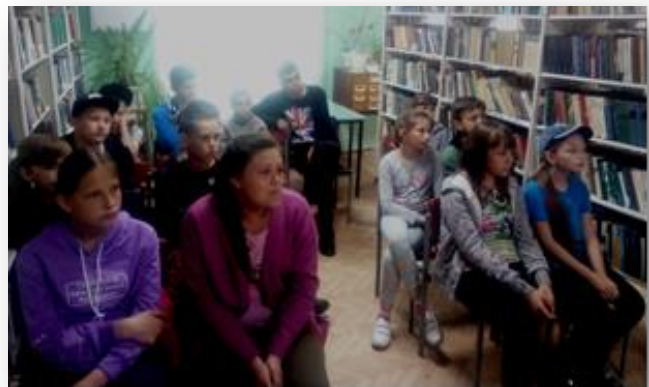
Кинолекторий «Сын полка» МБУ «Библиотека» ЦБС г. Колпашево