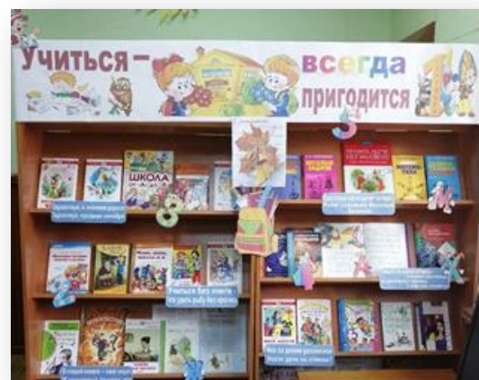
Учиться – всегда пригодится МБУ «Библиотека» г. Колпашево