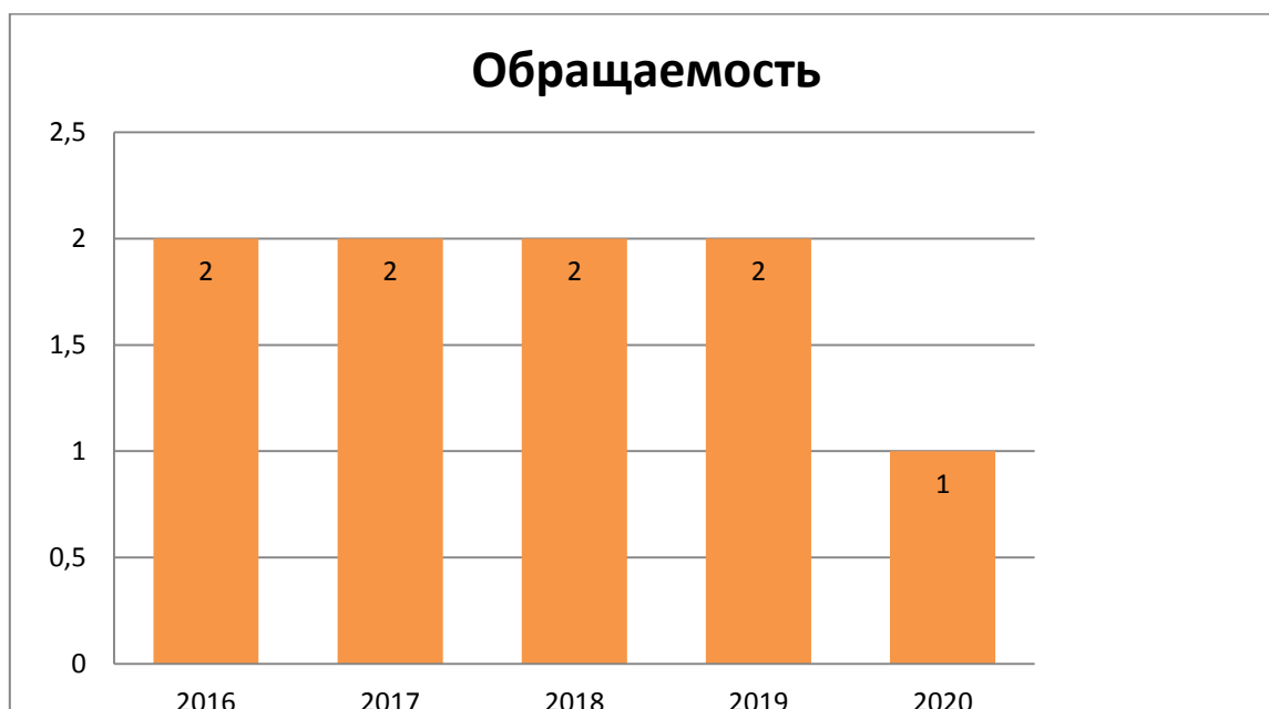
Рис. 6. Динамика показателя обращаемости библиотечного фонда для детей до 14 лет.