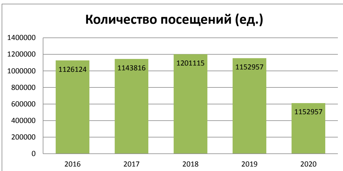
Рис. 2. Динамика количества посещений муниципальных библиотек читателями возраста до 14 лет.

Количество посещений в 2020 г. уменьшилось на 541350 по сравнению с 2019 г. по объективным причинам, связанным с эпидемиологической обстановкой.