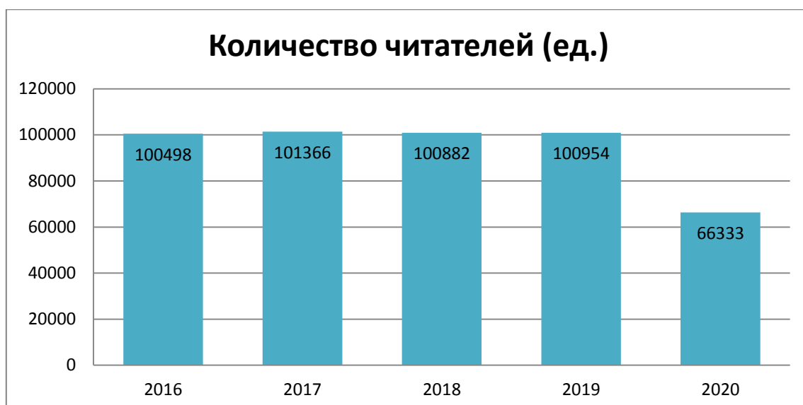
Рис. 1. Динамика количества читателей до 14 лет.

Количество читателей-детей в библиотеках Томской области в 2019 г. составило – 100954, в 2020 г. составило – 66333, т.е. на - 34621 чел. меньше.