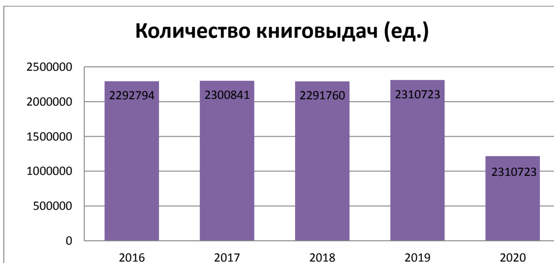
Рис. 3. Динамика количества книговыдач читателям в возрасте до 14 лет.

Книговыдача детской литературы в библиотеках области в 2020 г. составила – 1217375, в 2019 г. составила – 2310723, меньше на 1093348.