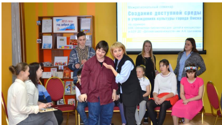
Фото 1 Инклюзивный клуб «Мы вместе» Омской областной библиотеки для детей и юношества

здоровья. Приглашаем к просмотру материалов всех заинтересованных специалистов и руководителей детского и молодежного чтения.