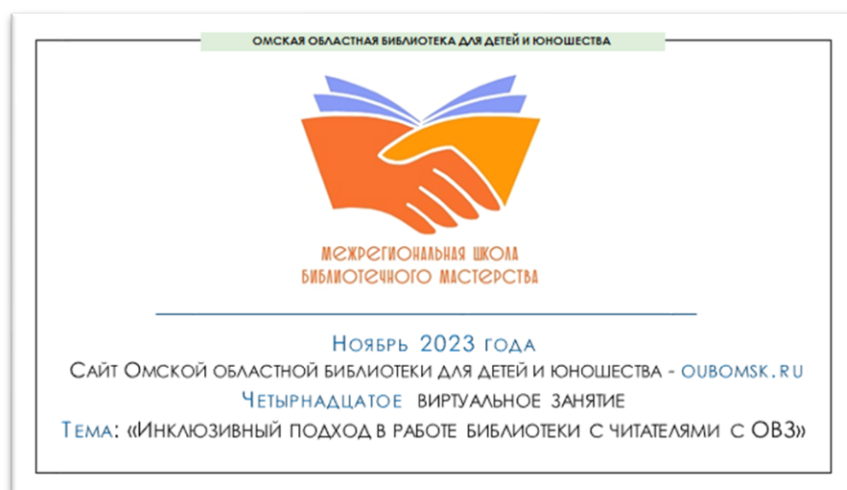
Фото 4 Страница Межрегиональной школы библиотечного мастерства на сайте Омской областной библиотеки для детей и юношества