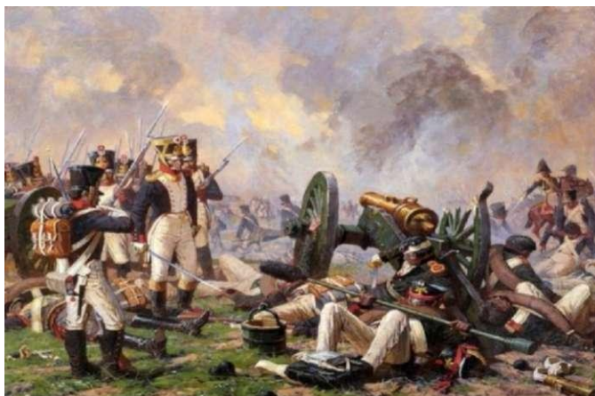
Сражения. Отечественной войны 1812 года. А. Ю. Аверьянов