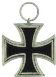
Офицерский Кульмский крест

Наградных документов (грамот) на Кульмский крест не выдавалось. Неопределённость в статуте награды продолжалась длительное время, пока Николай I не уравнивал её с российской медалью.