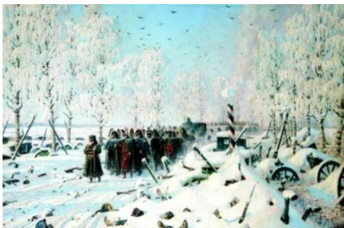
Отступление. Бегство на большой дороге. В. Верещагин.