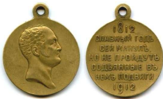
Юбилейная медаль «В память 100-летия Отечественной войны 1812 года»

Медаль получили и прямые потомки по мужской линии адмиралов, генералов и офицеров, а также священнослужителей, участвовавших в войне 1812 года, и прямые потомки генерал-фельдмаршала светлейшего князя М.И. Голенищева-Кутузова-Смоленского по женской линии