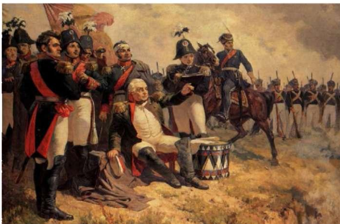
Кутузов во время Бородинской битвы. А. Шепелюк.