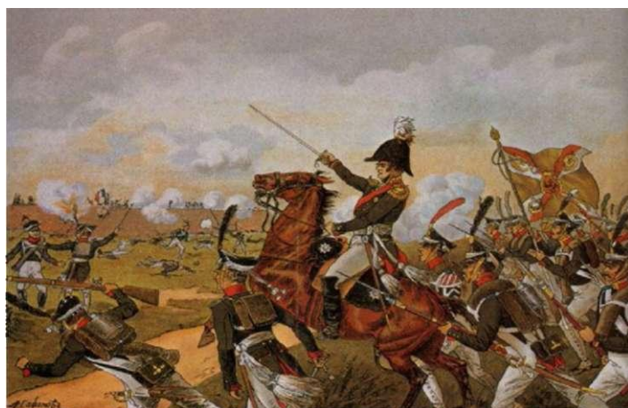
Бородинское сражение. А. Сафонов