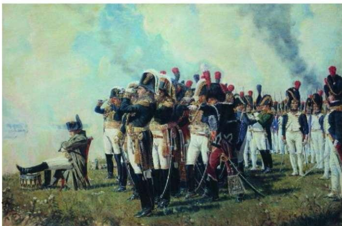
Наполеон на Бородинском поле. В. Верещагин.