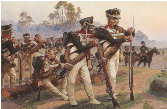
Сражения. А.Ю. Авсрянков.