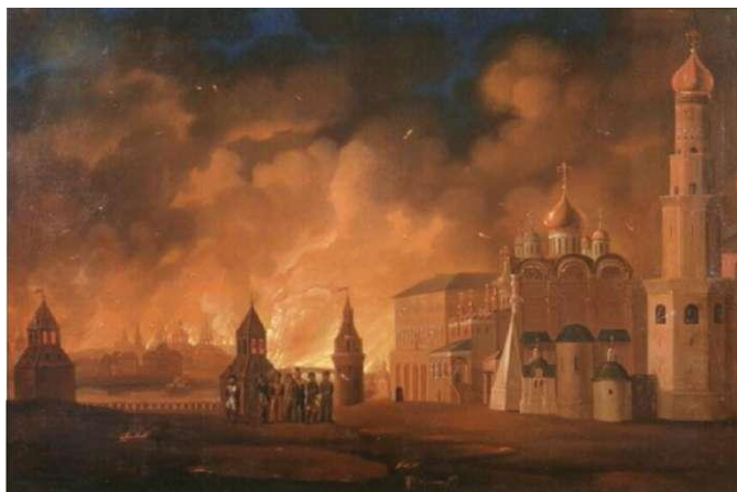
Пожар Москвы. А. Ф. Смирнова