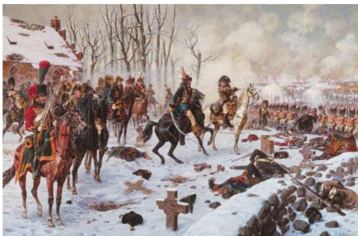
Сражение под Прейсиш-Эйлау А. Ю. Аверьянов.