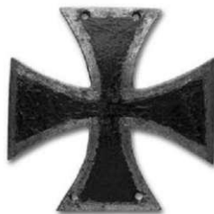
Солдатский Кульмский крест

12 августа 1912 года император Николай II учредил юбилейную медаль «В память 100-летия Отечественной войны 1812 года». На лицевой стороне находится поплечное, вправо развернутое изображение императора Александра I. На оборотной стороне семистрочная надпись: «1812 СЛАВНЫЙ ГОДЪ СЕЙ МИНУЛЬ НО НЕ ПРОЙДУТ СОДЪЯННЫЕ В НЕМЪ ПОДВИГИ 1912».