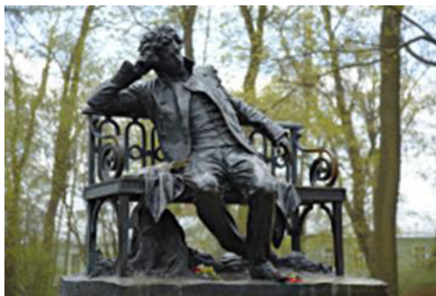
Памятник Пушкину в Царском Селе

«Нет сомнения, что он создал наш поэтический, наш литературный язык и что нам и нашим потомкам остаётся только идти по пути, проложенному его гением...»