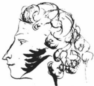
Автопортрет А.С. Пушкина

«Из русского языка Пушкин сделал чудо...» В.Г. Белинский