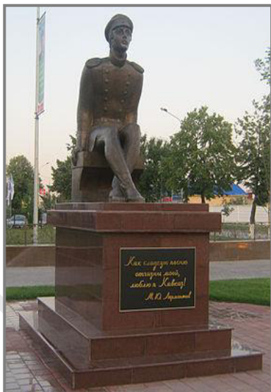
Памятник М. Ю. Лермонтову в Грозном, 2012 г. Скульптор Николай Ходов