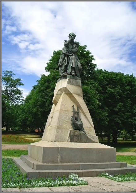
Памятник М. Ю. Лермонтову в Пятигорске, 1889 г.