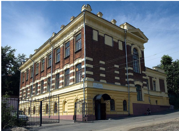
г. Томск, ул. Лермонтова, 60

История названий томских улиц / Г. Н. Старикова, Л.А. Захарова, Е.В. Иванцова и др.— Изд. 2-е, доп. и испр.— Томск : D`Print, 2004 .— С. 174.