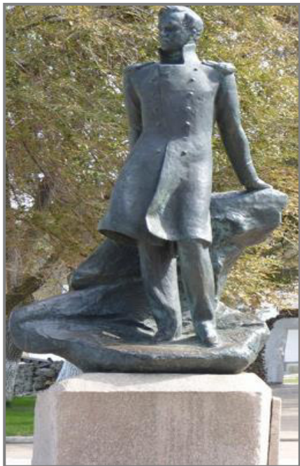
Памятник М. Ю. Лермонтову в ст. Тамань, 1984 г. Скульптор Исаак Давидович Бродский.