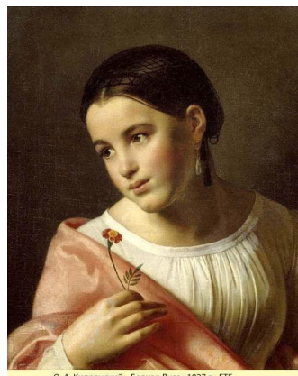
О. А. Китренский. Бедная Лиза. 1827 г. ГТГ

индивидуализирован, его внутренний мир обогащается способностью сопереживать, чутко откликаться на происходящее вокруг. Публикация этих произведений имела большой успех у читателей того времени, повесть Н. М. Карамзина «Бедная Лиза» вызвала множество подражаний. Сентиментализм Карамзина оказал большое влияние на развитие русской литературы.