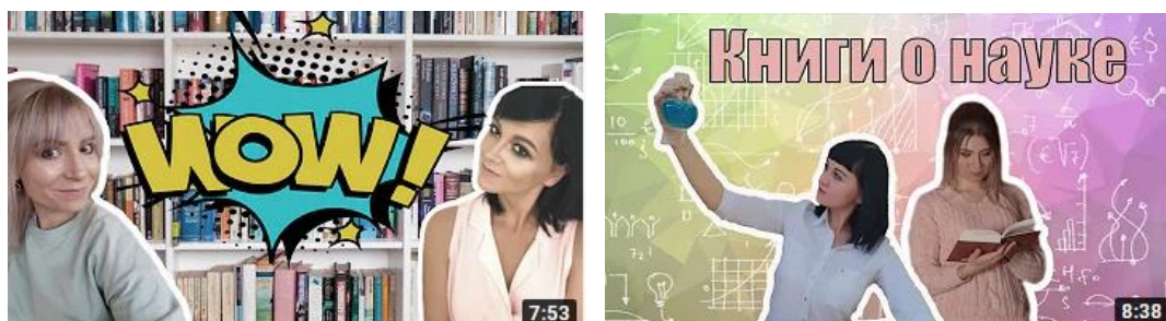
Рис. 1. Пример обложек букблога ТОДЮБ.

При оформлении блога важно позаботиться о дизайне и обложках (превью) к каждому выпуску. Они должны быть яркими и узнаваемыми. Существуют определенные стандарты, которые должны соблюдаться абсолютно всеми пользователями независимо от тематики блога, количества элементов на изображении и прочих индивидуальных особенностей. Лучшее фото профиля — это портрет ведущего. Подписчикам всегда интересна личность автора. Например, стандартное (или полное) разрешение обложки для « YouTube »-канала – 2560x1440 пикселей. В частности, фон для обложки канала на « YouTube » не должен содержать слишком много деталей, а только четкие объекты и надписи, дополняющие друг друга по смыслу. Это могут быть фотографии ведущих в разных образах, крупные надписи и атрибутика по теме ролика. Пример обложек выпусков блога ТОДЮБ представлен на рис. 1.