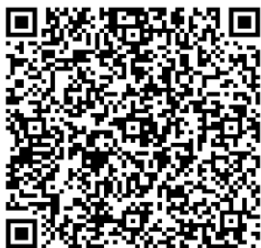
Виртуальная выставка «Женское лицо Победы»

Выставки «Женское лицо Победы» и «Томские женщины - женщины России. 13 выдающихся женщин Томска» продолжили свою жизнь в электронном формате. Благодаря этому появилась возможность добавлять интерактив к выставкам - музыкальное сопровождение при перелистывании слайдов, включение графических и видеофрагментов. Более подробно с ними можно ознакомиться на сайте нашей библиотеки odub.tomsk.ru в разделе «Виртуальные выставки».