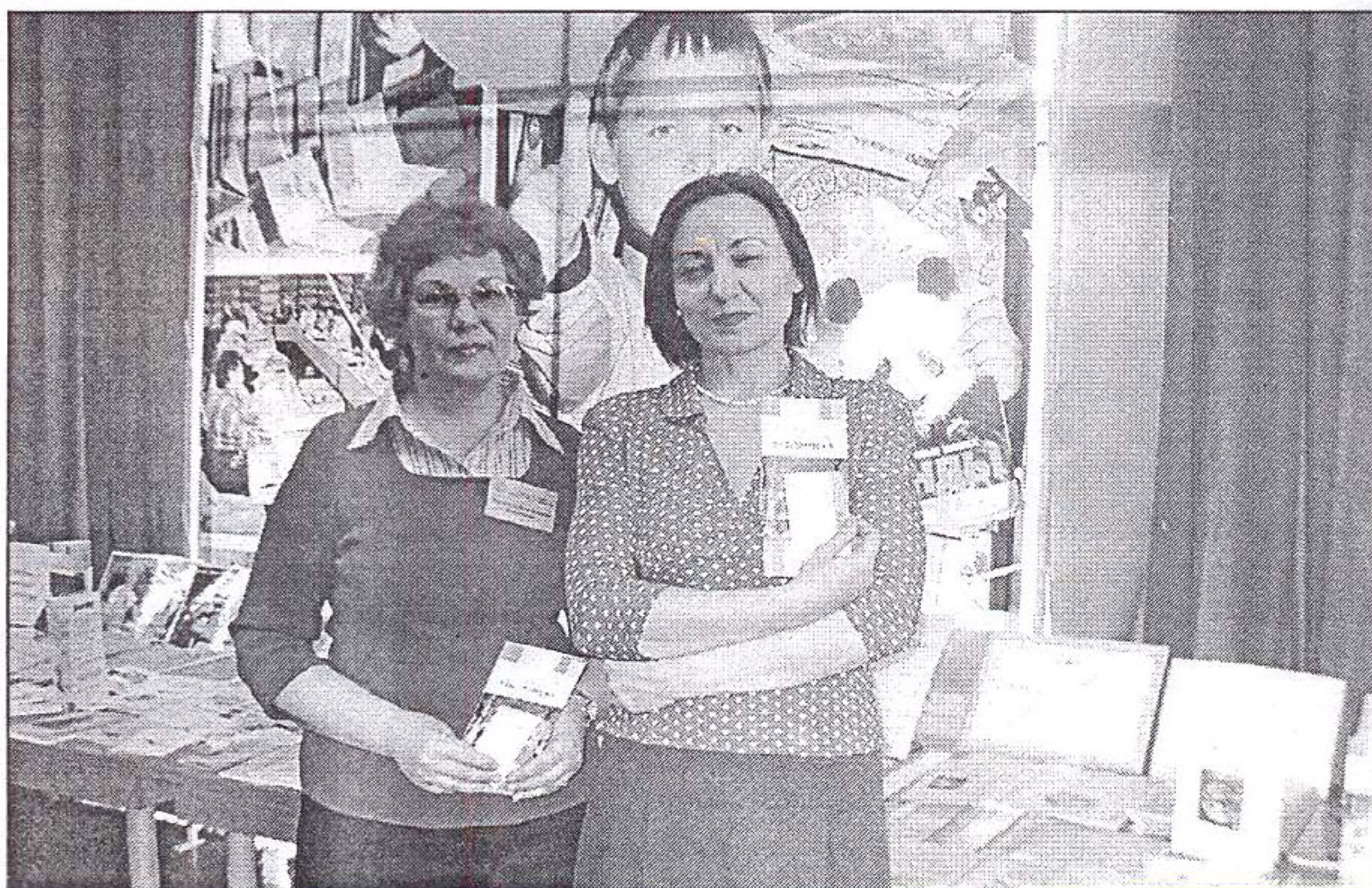
Посетители выставки у стендов ТОДЮБ на празднике «День работника культуры»

Своеобразную летопись движения в поддержку чтения помог создать фотоконкурс «Я и книга в объективе», в котором приняли участие более 100 человек из г. Томска и девяти районов нашей области. Особой активностью в нем отличились дети и подростки, прислав-