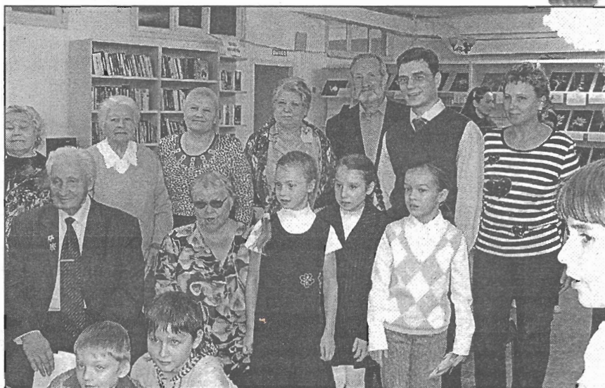
● В последний день конкурса они все вместе — организаторы, члены жюри и почетные гости

Признаюсь, поначалу это подслушанное признание вызвало невольную улыбку: да что вы понимаете в жизни?.. А позже подумалось: наверное, это и есть истинный патриотизм, когда скучаешь по родным местам, по маме, папе, брату, бабушке. Когда щемит сердце при воспоминании о своей семье и доме, когда сравниваешь южные места с бескрайними сибирскими просторами, где хочется кричать во все горло, где даже местные ко-