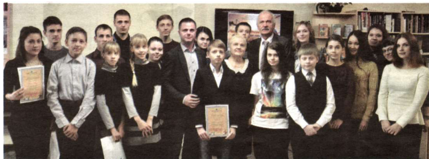
Фото на память о конкурсе