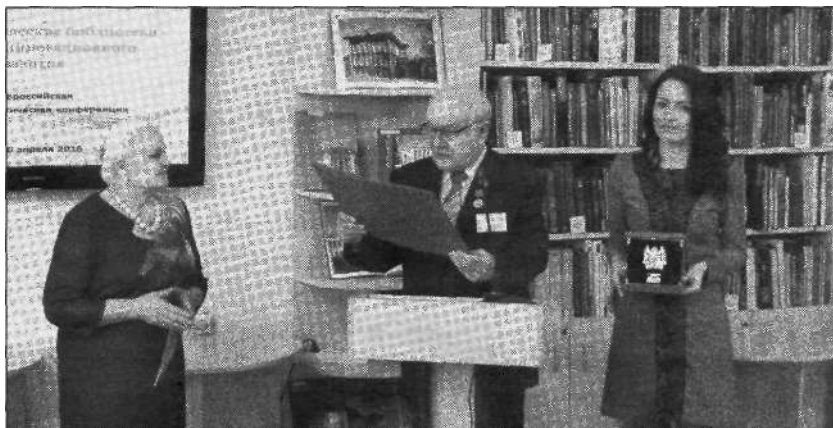
От Законодательной думы Томской области коллективу библиотеки вручены грамота и настольный почётный знак

Коллектив - команда высококвалифицированных специалистов, идущих в ногу со временем, быстро реагирующих на меняющуюся жизнь. Два сотрудника имеют звание «Заслуженный работник культуры РФ», трое - лауреаты премии Томской области в сфере образования, науки, здравоохранения и культуры, двое награжде-