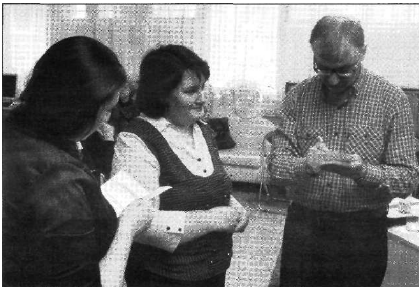
Автограф писателя И. БОЯШОВА его почитателям