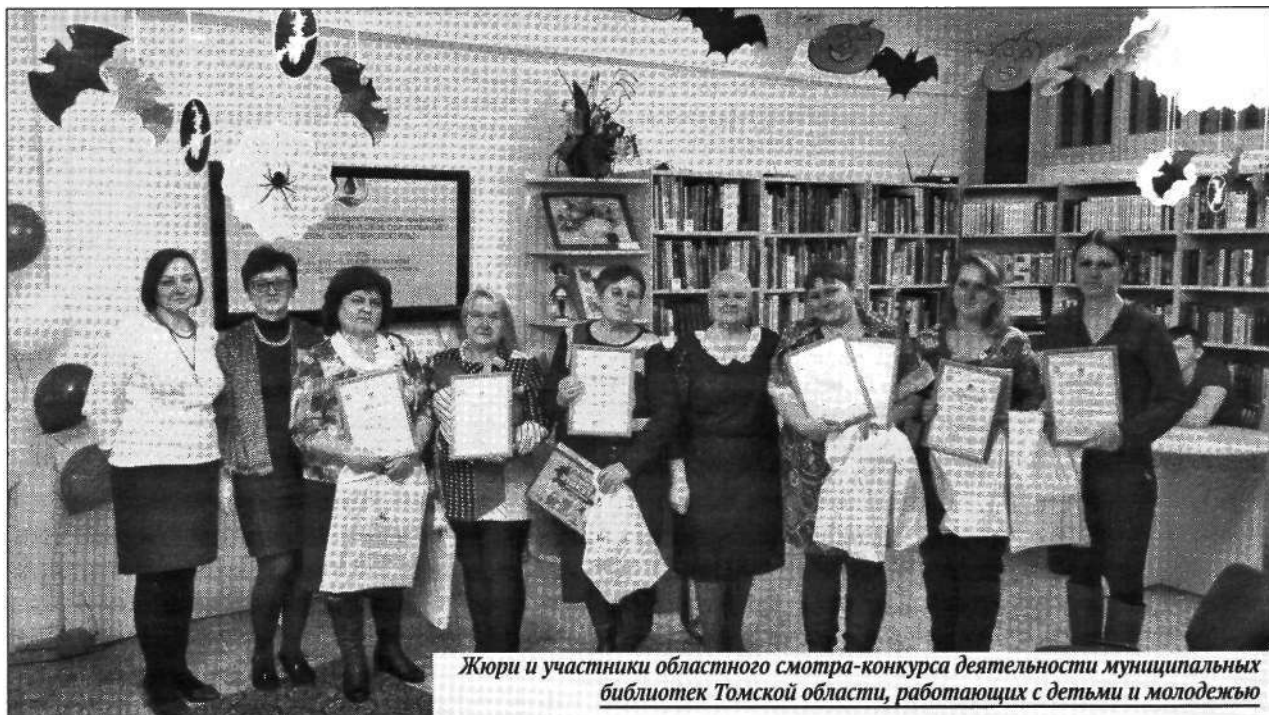
Жюри и участники областного смотра-конкурса деятельности муниципальных библиотек Томской области, работающих с детьми и молодежью

Ещё одна форма работы привлекла детей своей необычностью, а библиотекаря позволила лучше узнать читателей. В канун Нового года в библиотеке выросла ёлочка. Она была составлена из читательских пожеланий, написанных на