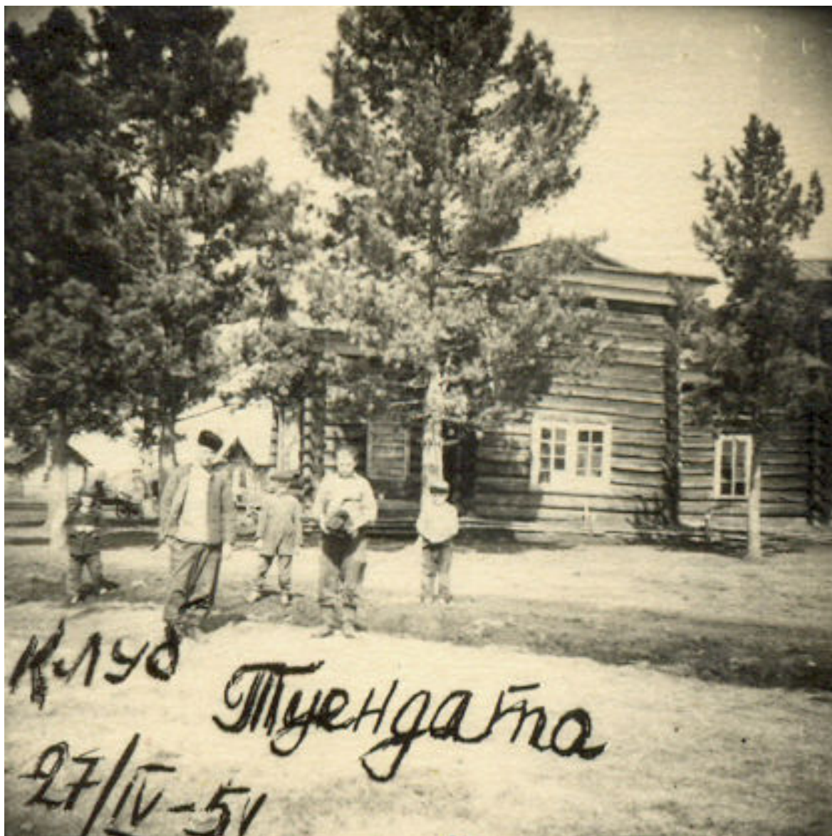
Здание клуба д. Туендат – бывшей Михайло-Архангельской церкви с. Ново-Архангельского (Туендата). 27. 04. 1951.