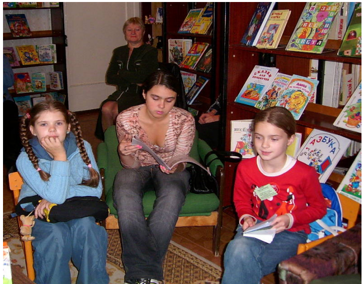
Творческая лаборатория младшей секции

Сколько их? Не сосчитать! Прячутся друг в дружке. Встанем вместе в хоровод Будем мы подружки!