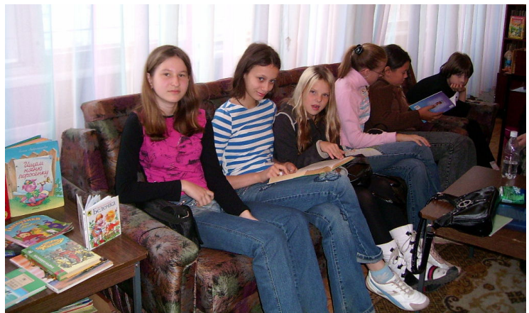
Творческая лаборатория младшей секции