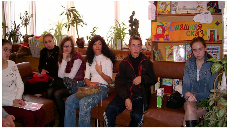
Творческая лаборатория старших поэтов

Ну, как же это выдержать?.. Убить хочу те образы, А их так много прыгает. Процесс идет мучительный, Покрылись мысли инеем. Делю страничку надвое, Ложатся грудой линии.