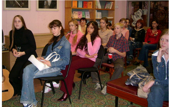
Творческая лаборатория средней секции

Нет гудка тепловоза, Не плывут корабли, Только гул самолётов Слышен где-то вдали.