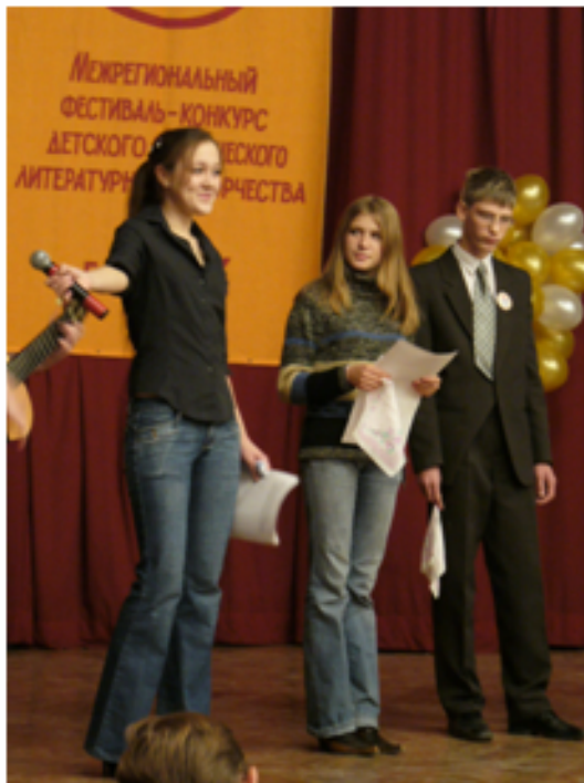
Приветствие от лаборатории юных поэтов