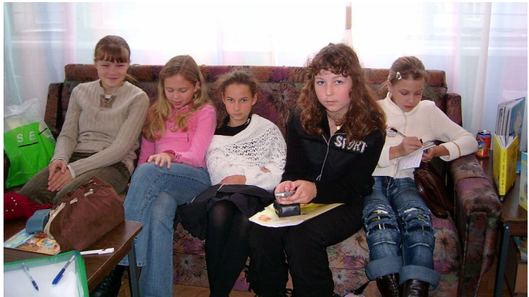
Творческая лаборатория младшей секции

По травяной дорожке Наискосок от кошки- Свернувшись на крылечке, Она лежит клубком. Иду к неспешной речке С песчаным островком. Баюкает река Гусей и облака. По улочке мощеной, «Речкою» нареченной, Бреду, и стуки, стук!- По камешкам каблук. И вот тенистый скверик- Лужайки и ручьи. Дерутся у скамеек За крошки воробьи. Один схватил утайкой Пол крошки на обед, И все крикливой стайкой За ним умчались вслед. Я гордо утром рано Пойду из края в край. Пешком ходить устану- И сяду на трамвай.