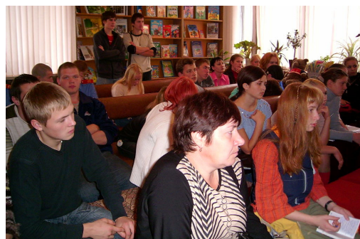
Творческая лаборатория старших поэтов